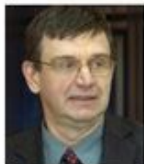
Szalay Imre, PMP elnök