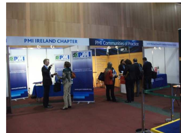
Kiállítási kép az ír tagozat és a CoP standjával