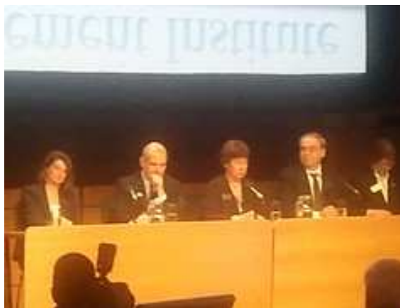
A PMI vezetői a pulpituson