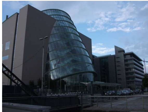
A LIM és a kongresszus helyszíne: Dublin Convention Center