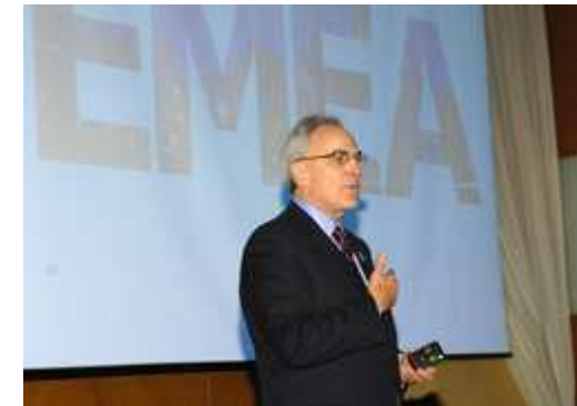
Greg Balestrero, PMI CEO

Természetes, hogy az EMEA kongresszuson a világ minden részéről is itt vannak. Az amerikai Phoenix chapter ( www.phx-pmi.org ) képviselője direkt azzal a céllal, hogy "Sister Chapter"-eket keressen, így jár végig mindenkit. Legyünk testvérek? Az osztrákok is aktívak, őszi nagy, többszáz résztvevős konferenciájukra toboroznak ( http://ppms.pmi-austria.org/Content.Node/ppms/ ). A téma, mint nálunk is a portfólió menedzsment.